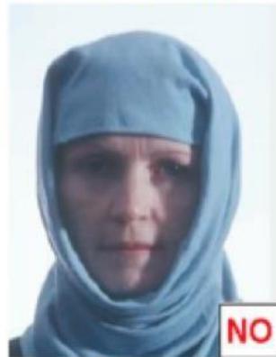
Parte del viso coperta