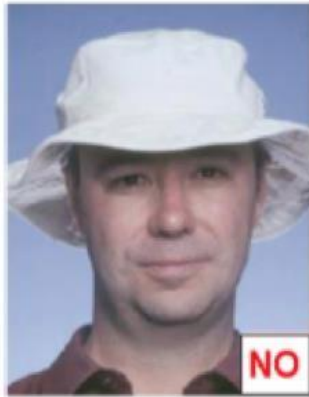
Indossa il cappello

Non sono ammessi copricapo a meno di motivi religiosi, culturali o medici. In ogni caso il volto deve essere mostrato chiaramente.