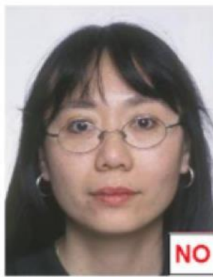
Montatura copre occhi