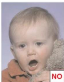
Oggetto in evidenza