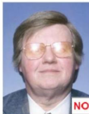
Riflesso sulle lenti