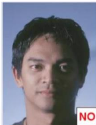
Ombra sul viso