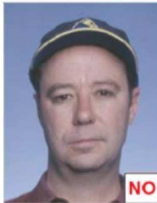
Indossa il berretto