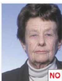
Testa non centrata

La testa deve essere centrata verticalmente.