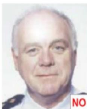
Riflesso del flash