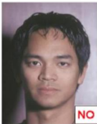
Ombra sulla sfondo

Non devono essere presenti ombre sul viso o sullo sfondo.