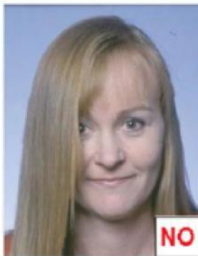
Occhi coperti da capelli

Gli occhi non devono essere coperti da capelli.